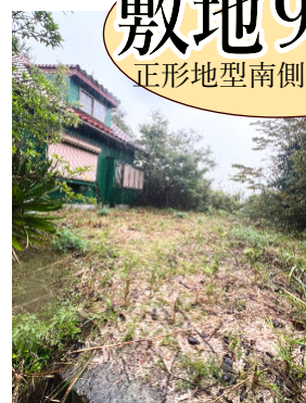
庭木2本(栗の木もみじ) ※雑木笹竹など伐採手配中